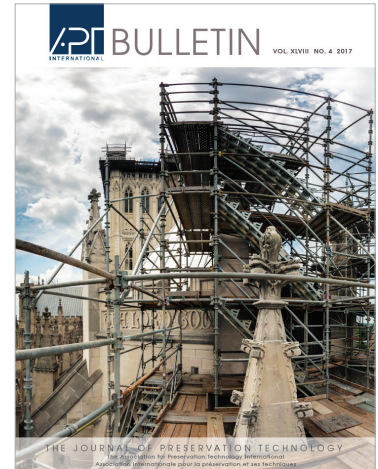
APT Bulletin: A Revista sobre Tecnologia da Preservação

A Building Technology Heritage Library (BTHL) é um arquivo digital de catálogos e livros técnicos históricos no campo da construção e técnicas construtivas históricas. Com atualização constante e direitos livres de copyright, é uma preciosa fonte de pesquisa para arquitetos, conservadores e outros profissionais interessados no tema.