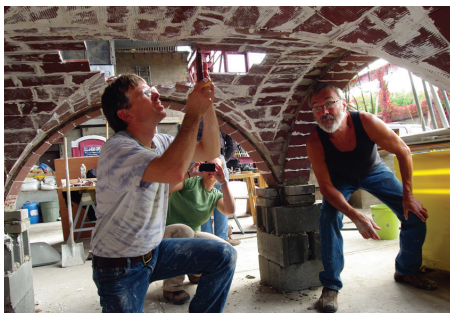
Construction de coffres-forts dans l'atelier pratique de construction de la voûte catalane, Congrès annuel d'APT, 2013, New York