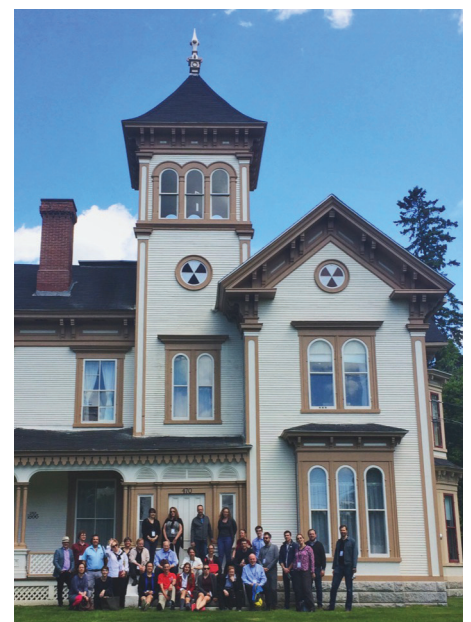
Atelier sur le granit des Appalaches dans la Maison Butters à Stanstead, Québec, 2018