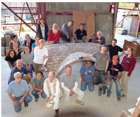
Participants à l'atelier pratique pour la construction de la voûte catalane

et des Etats-Unis, APT compte environ 1 500 membres dans plus de trente pays, notamment des gestionnaires du patrimoine, des architectes, des ingénieurs, des restaurateurs, des conseillers, des constructeurs, des artisans, des conservateurs de musées, des promoteurs, des professeurs, des historiens, des paysagistes, des chercheurs et des techniciens.